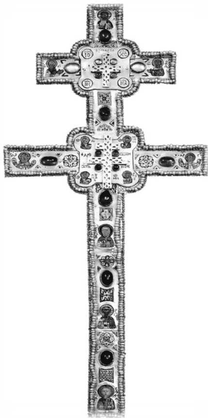
Крест Евфросинии Полоцкой — напрестольный крест, изготовленный для церкви Святого Спаса в городе Полоцке по заказу Евфросинии полоцким мастером Лазарем Богшей в 1161 году

Следуя зову Божию, получив благословение епископа, преподобная с одной из черноризиц вскоре отправилась в путь, взяв с собой только книги и три хлеба. Придя в загородное Сельцо, она водворилась там и стала еще усерднее подвигаться в молитвах к Богу.