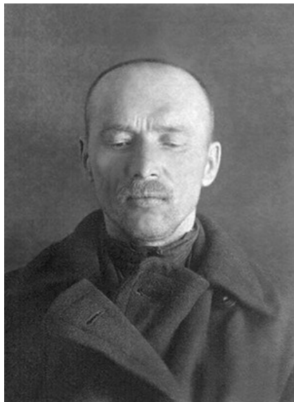
Диакон Иосиф Сченснович Москва. Тюрьма НКВД. 1937

Священномученик Иосиф (Сченснович) родился 7 июня 1886 года в местечке Жировицы Слонимского уезда Гродненской губернии в семье белорусского крестьянина Антония Сченсновича. Настрой семьи был глубоко православным, и Иосиф с юности посвятил свою жизнь служению Церкви. В 1901 году Иосиф окончил Жировицкое Духовное училище. В 1903 году он окончил курсы псаломщиков в городе Гродно, и был определен псаломщиком в храм в селе Великий Лес Брестского уезда Гродненской губернии, где про-